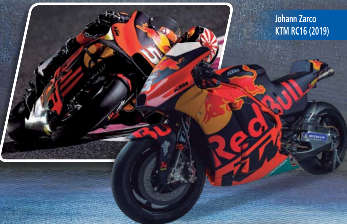
Johann Zarco KTM RC16 (2019)