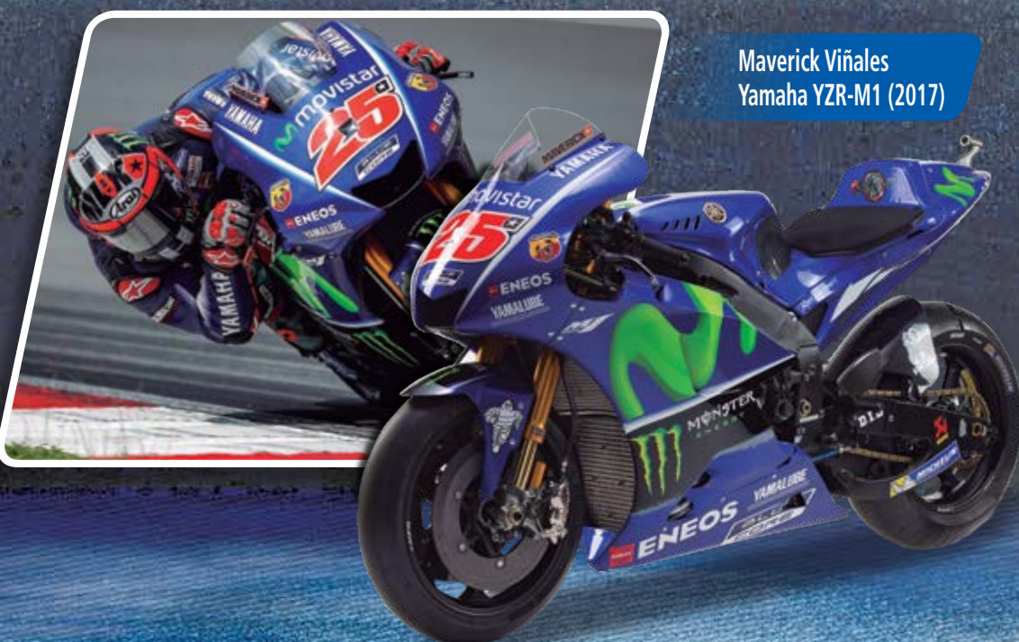
Maverick Viñales Yamaha YZR-M1 (2017)