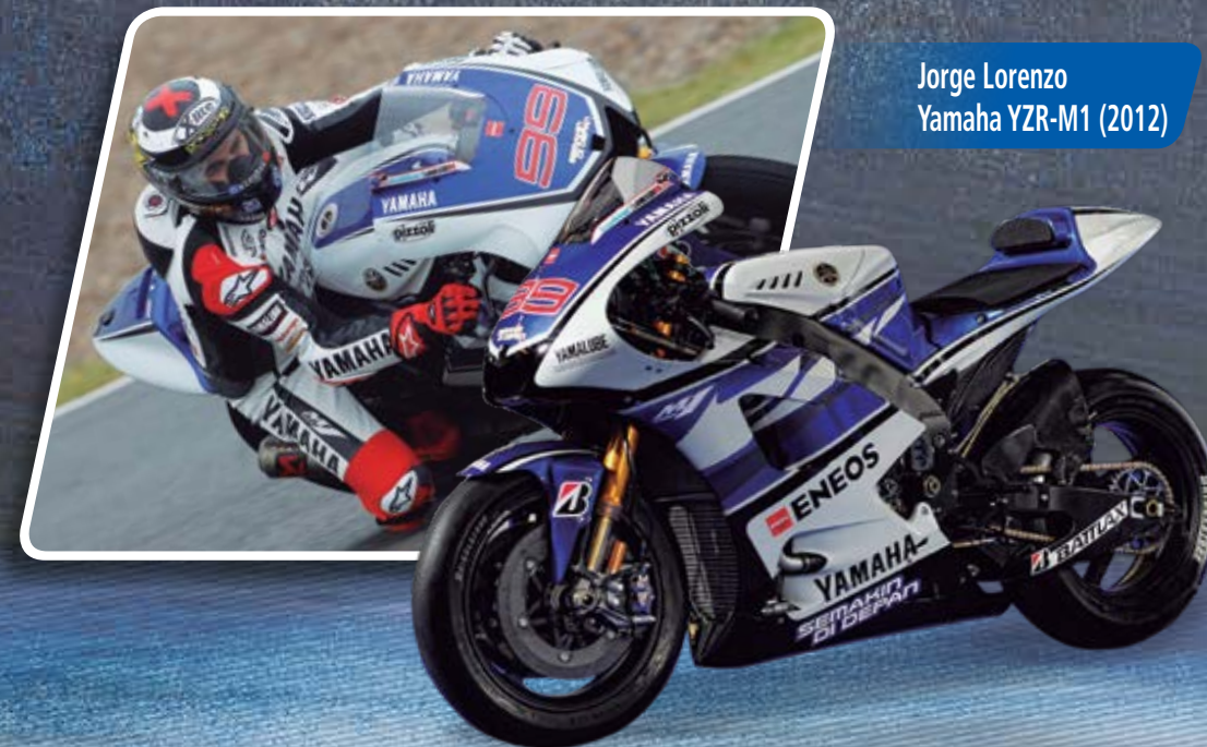
Jorge Lorenzo Yamaha YZR-M1 (2012)