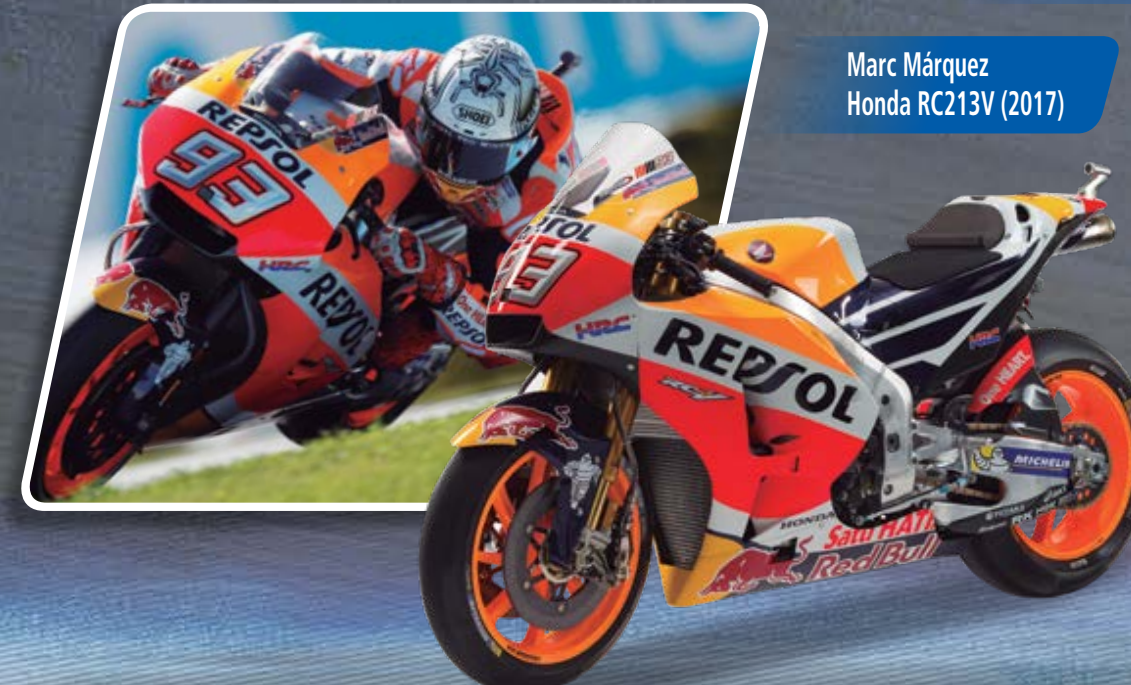
Marc Márquez Honda RC213V (2017)