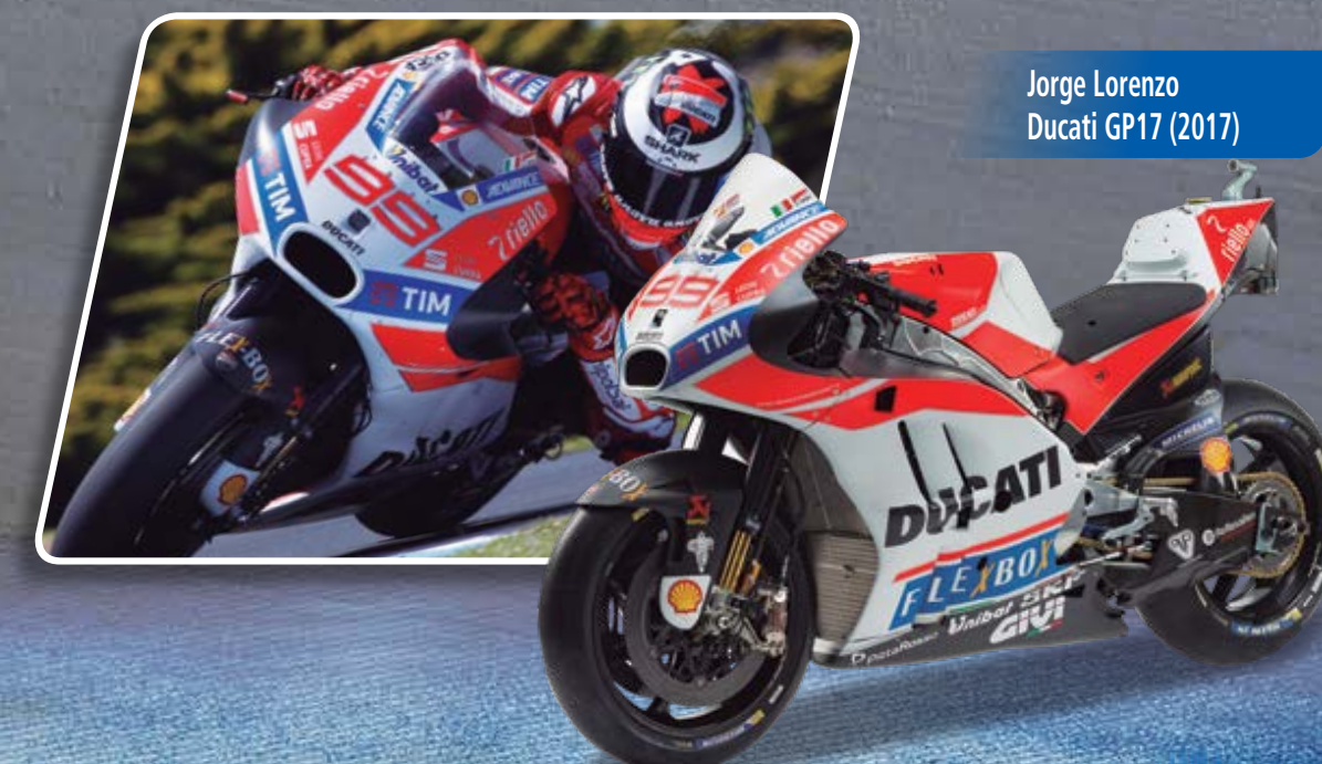
Jorge Lorenzo Ducati GP17 (2017)