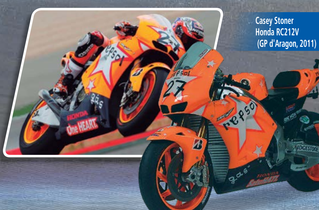
Casey Stoner Honda RC212V (GP d'Aragon, 2011)