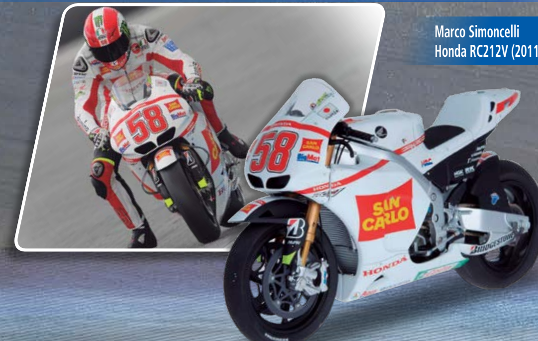
Marco Simoncelli Honda RC212V (2011)