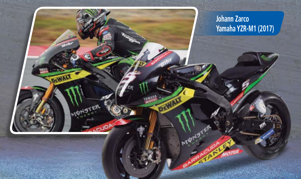
Johann Zarco Yamaha YZR-M1 (2017)

Première saison chez Yamaha et première victoire dans un Grand Prix de MotoGP™