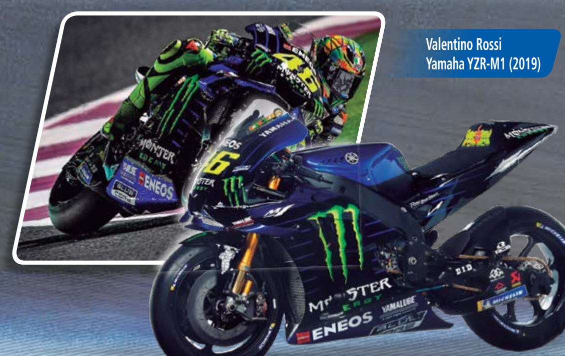
Valentino Rossi Yamaha YZR-M1 (2019)